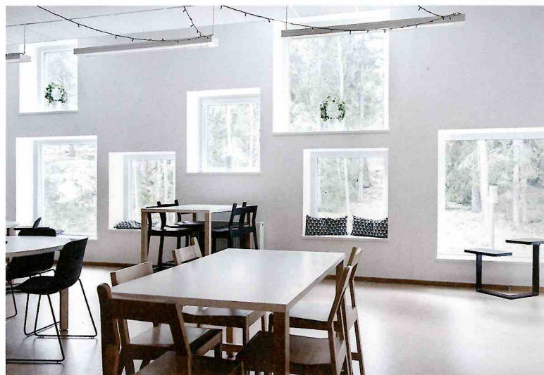
Så här ser ett av undervisningsrummen ut.