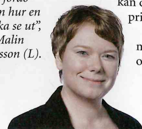
Vårt Huddinge #5 2018