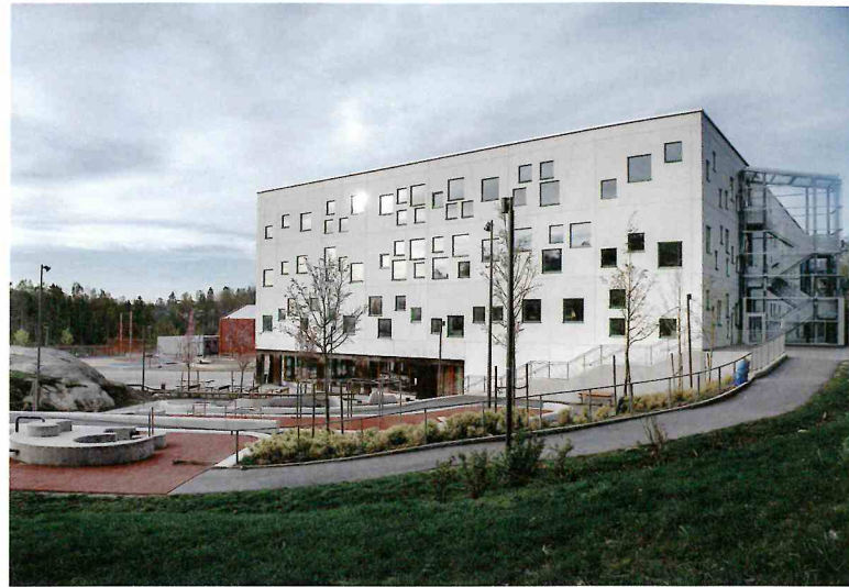
Med 558 röster är Glömstaskolan vinnare av Huddinges byggnadspris 2018.